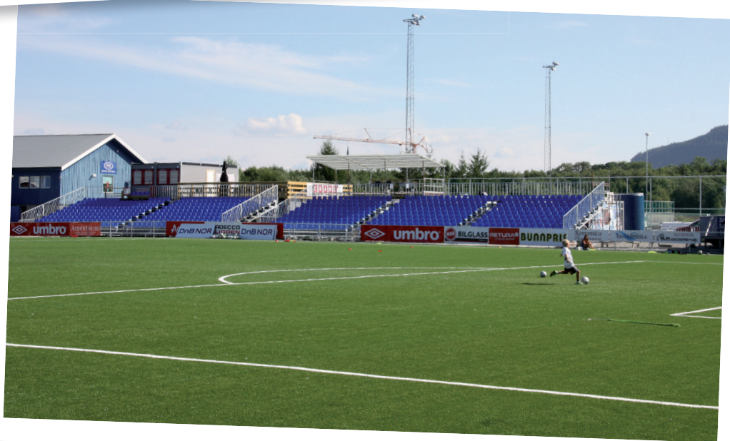
Betydelig oppgradering av fotballanlegget i 2010.